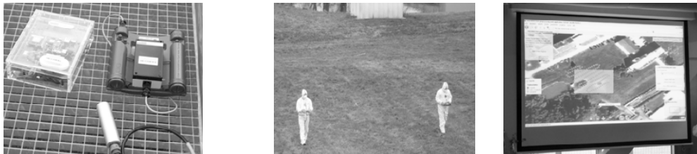
Abb. 2: -time COP: SSM-1 Prototypen – Strahlenspürung – Echtzeitauswertung

Als Übungsannahme diente das Szenario eines Satellitenabsturzes, mit der Aufgabe, die verstrahlten Wrackteile des Satelliten mit einer Boden-Suchmannschaft möglichst effektiv aufzuspüren und die gewonnenen Strahlenmessdaten kartografisch aufbereitet ‚real-time‘ in Lagebildsysteme einzubinden. Getestet wurde dieses real-time COP System als Ergänzung im Rahmen einer klassischen Strahlenspürübung erweitert mit folgenden Komponenten: